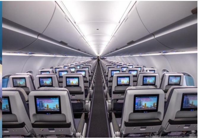
A321neo LR Business class: 2-2 & 1-1