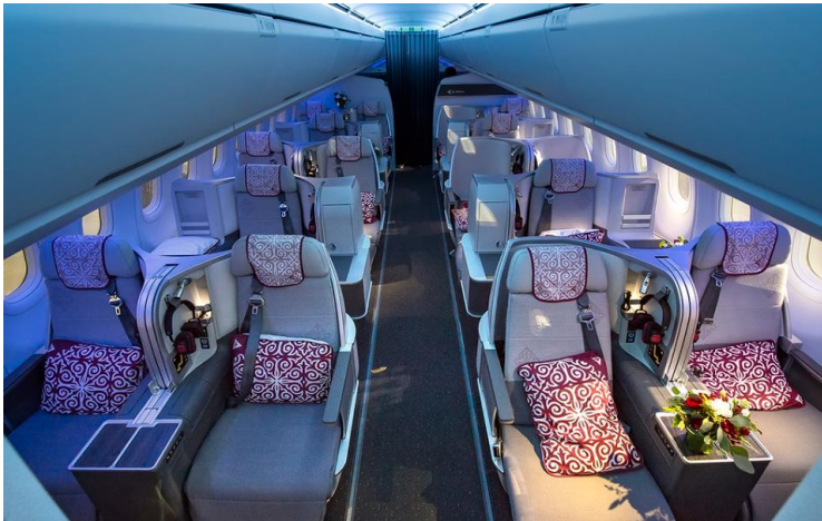
A321neo LR Business class: 2-2 & 1-1