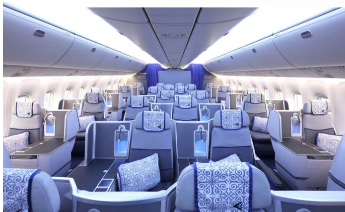
B767 Business class: 1-2-1